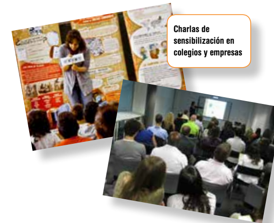
Charlas de sensibilización en colegios y empresas