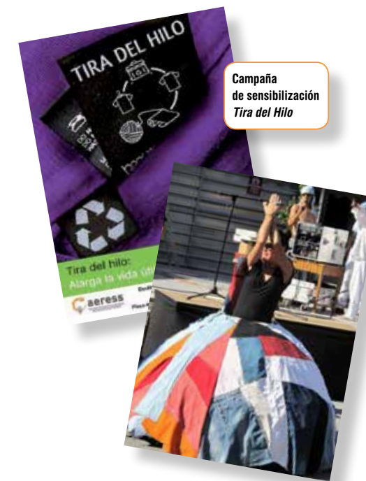
Campaña de sensibilización Tira del Hilo

AERESS y las entidades socias desarrollan una importante labor de sensibilización a través de campañas a nivel nacional que son replicadas en cada uno de los territorios, así como a través de charlas de sensibilización al servicio de ayuntamientos, colegios, empresas, etc.